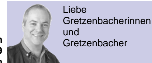
Liebe Gretzenbacherinnen und Gretzenbacher

Willkommen im Jahr 2010. Die Wahlen gehören der Vergangenheit an, die Zukunft gehört denen, die sich den Herausforderungen stellen.